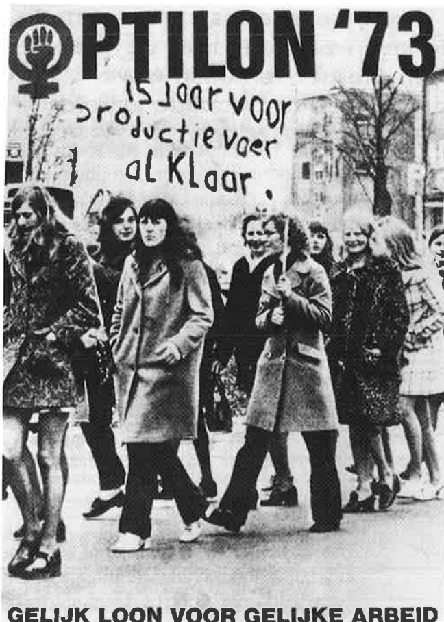
GELIJK LOON VOOR GELIJKE ARBEID

In navolging van de Amerikaanse National Organisation for Women (NOW) en van ontwikkelingen in Zweden werd de eerste Nederlandse organisatie van de nieuwe tweede golf opgericht, de Actiegroep Man Vrouw Maatschappij (MVM). MVM, waarvan Kool-Smit in 1968 de voornaamste oprichter was, bracht de boodschap van het nieuwe feminisme samen in een radicaal programma dat kernpunten van de tweede golf bevatte, zoals de noodzaak tot doorbreking van versterde rolpatronen, de komst van alternatieve samenlevingsvormen en het zelfbeschikkingsrecht voor vrouwen inzake abortus. In dit programma werd tevens de eis tot herverdeling van de betaalde en onbetaalde arbeid tussen de seksen overgenomen. Daarnaast sprak men zich expliciet uit