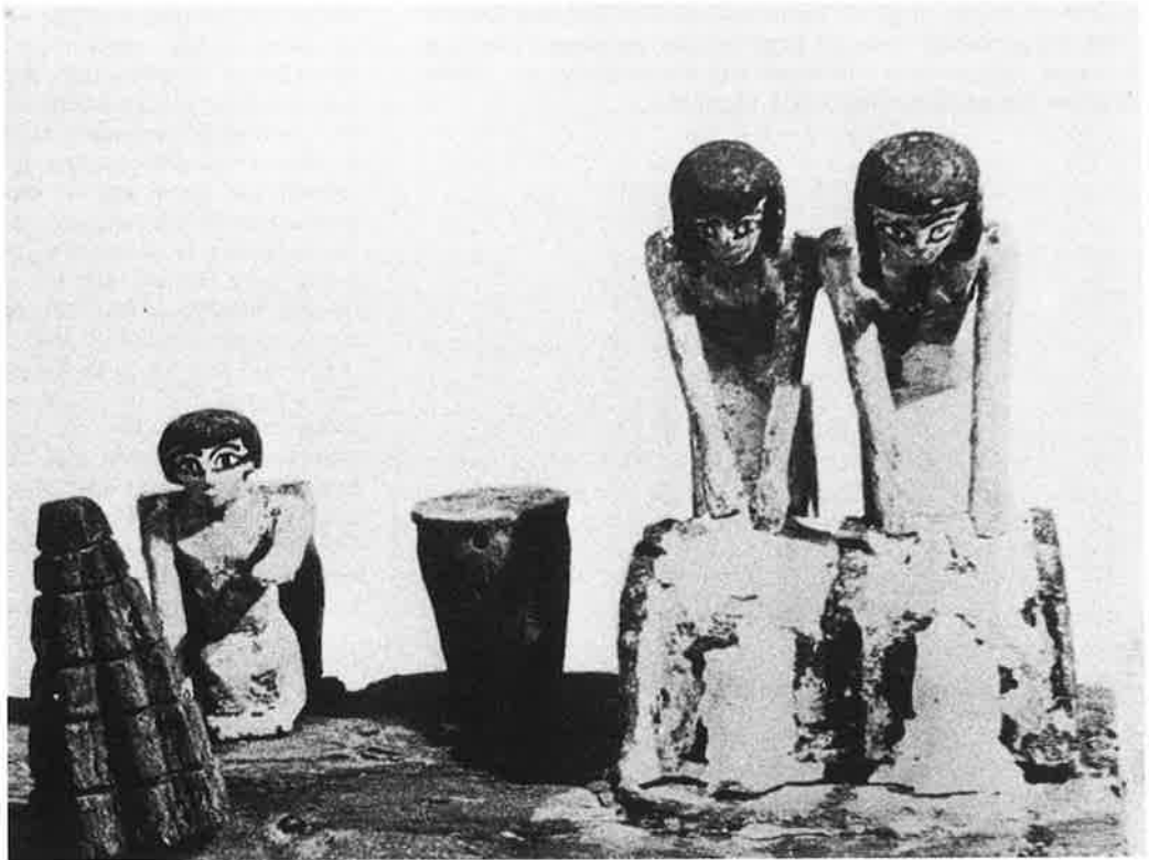
Houten model van de bereiding van brood. Twee vrouwen malen meel, terwijl een man de oven in de gaten houdt (Deir el-Medina, tussen 1955 en 1750 v. C.). Bron: A.M Donadoni Roveri (red.), Egyptian civilization. Daily life . Milan, 1987.

Het huwelijk wordt veelal gezien vanuit ons hedendaagse, westerse perspectief dat sterk door het christendom is beïnvloed en soms het zicht op verbintenissen in andere tijden en culturen belemmert. Als we kijken naar het ontstaan van huwelijken in Deir el-Medina blijkt dat er allereerst een vorm van onderhandeling tussen de families van de twee kandidaten nodig was. Het is niet bekend of de twee partners zelf veel te zeggen hadden. Het is evenmin bekend of en in hoeverre de 'romantische liefde' een rol speelde bij de partnerkeuze. Liefdesliederen schilderen weliswaar een levendig beeld van verliefde jongens en meisjes die naar elkaar verlangen, maar in de context van deze liederen speelt het huwelijk bijna nooit een rol. Toch lijkt het aannemelijk dat jonge mensen in het oude Egypte reeds voor hun huwelijk seksueel actief waren.