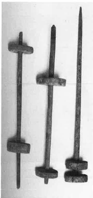
Houten spoelen voor het spinnen (Deir el-Medina, tussen 1540 en 1070 v. C.).

maken op goederen uit de nalatenschap. Echtgenoten kregen geen zeggenschap over de persoonlijke goederen van hun vrouwen; echtgenotes verkregen wel het recht op een derde deel van het gemeenschappelijk eigendom.