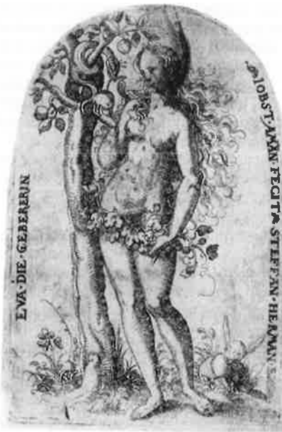
Jost Amman, Eva: die gebererin , tweede helft zestiende eeuw, ets, Stuttgart, Graphische Sammlung.

Een voorbeeld van de verbeelding van Eva als eerste moeder in de prentkunst is een ongedateerde ets van de Duitse graveur Jost Amman (1539-1591). Deze toont Eva naast de