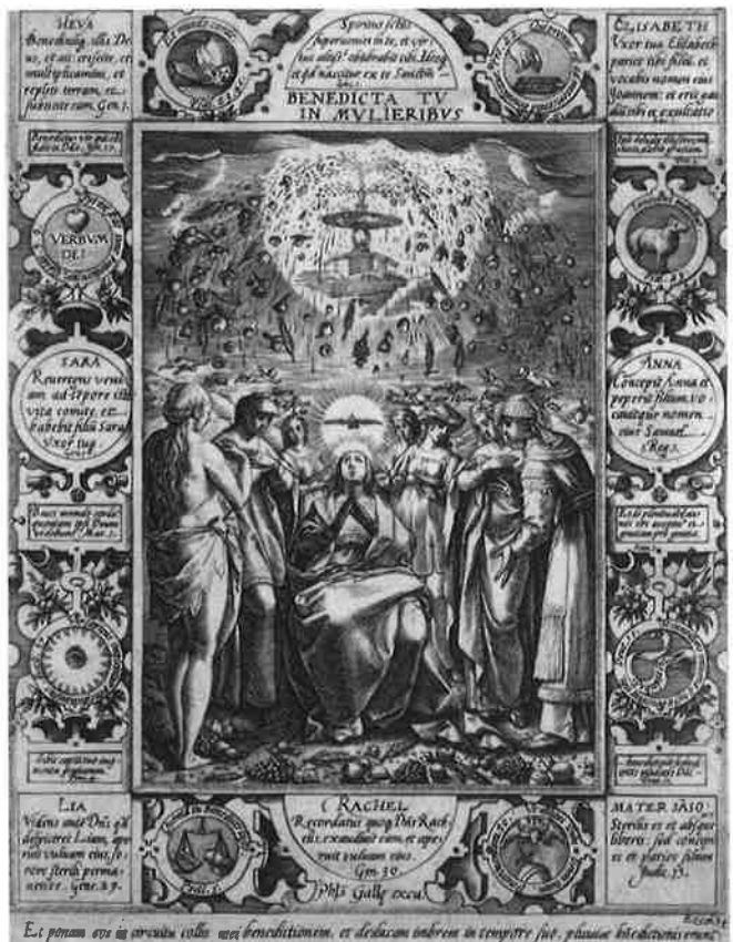
Hendrick Goltzius, Maria omringd door zeven bijbelse moeders , ca. 1578, gravure, Amsterdam, Rijksprentenkabinet.

De voorstellingen zijn volgens een vast schema opgebouwd: een vrouw staat of zit voor een landschap, met op de achtergrond een episode uit haar geschiedenis. Eva is aan het spinnen, wat de vrouwelijke ijver symboliseert. Dergelijke uitbeeldingen van Eva komen al sinds de Middeleeuwen voor en maken haar tot het prototype van een huiselijke vrouw. Ze