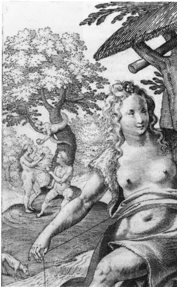
Johannes Baptista Collaert I naar Maarten de Vos, Eva , ca. 1590/1595, gravure, Rotterdam, Museum Boijmans Van Beuningen.