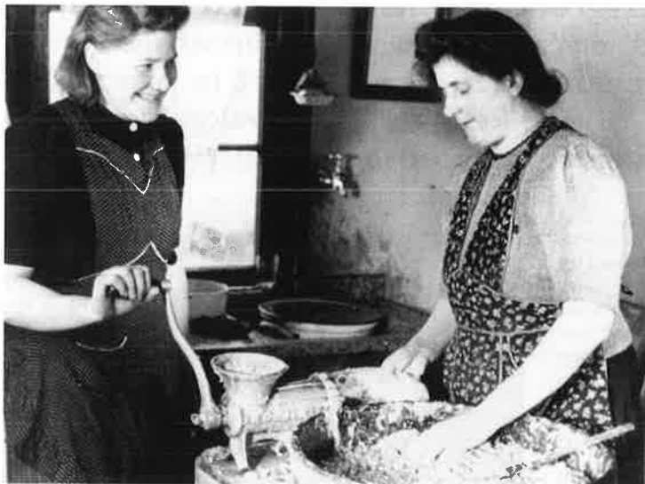
Twee vrouwen maken worsten in de boerderijkeuken.

daag de dag nadrukkelijk door vrouwen op het platteland onder de politieke aandacht wordt gebracht. Welvaart en welzijn op het platteland worden in Nederland steeds ter discussie gesteld. Dat heeft geresulteerd in allerlei ontwikkelingsprogramma's en stimuleringsmaatregelen. Fragmenten van deze geschiedenis zijn aangepakt. Toch ontbreken studies met een historische lijn waarin de veranderende genderverhoudingen zijn geïntegreerd. Nieuwe interessegebieden zoals vrije tijd en toerisme of het bank- en verzekeringswezen hebben op het platteland eveneens een andere geschiedenis. Zij vertegenwoordigen geheel andere belangen en (gemiste) kansen voor plattelands- en agrarische vrouwen dan voor vrouwen in een