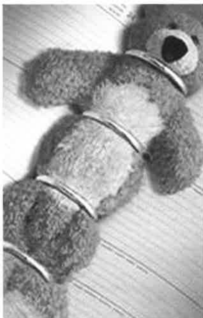
Publiekscampagne Werk en Privé Ministerie van SZW, 2001