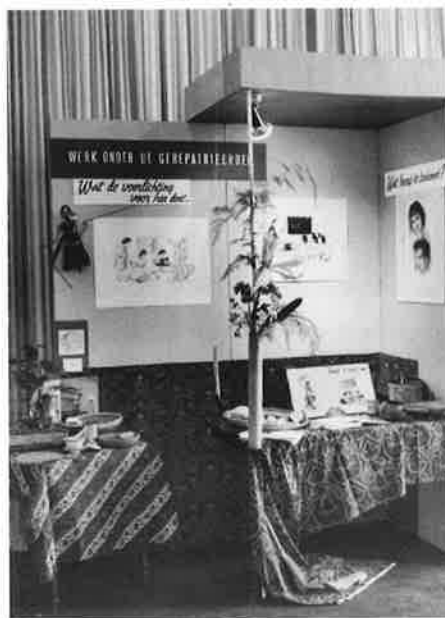
Tentoonstellingshoek van de Huishoudelijke Voorlichting ten Plattelande over hun werk voor de gerepatrieerden.